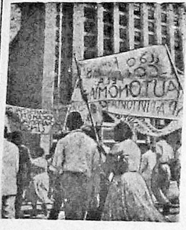
Рио-де-Жанейро (Бразилия). Демонстрация бразильских трудящихся в защиту демократических свобод и независимости страны.

Гроб с телом товарища Болеслава Берута будет находиться в гробнице на кладбище временно. В дальнейшем он будет перенесен в специальное сооружение Варшавской цитадели, где будут похоронены выдающиеся сыны польского рабочего класса и польского народа.